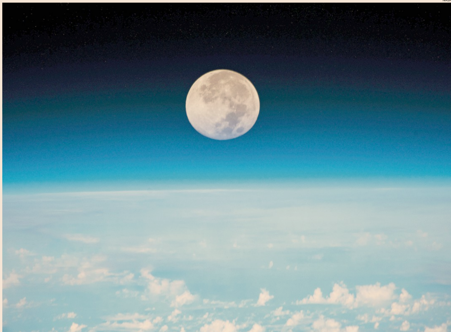
Astro d'argento. La luna piena vista dalla Stazione Spaziale Internazionale a 254 miglia sopra l'Oceano Pacifico a nord-est di Guam (2019)

to, pregiudizio o lotta nazionale nello spazio. I suoi pericoli lo rendono un ambiente ostile per tutti. La sua conquista richiede il meglio del genere umano, e le opportunità che offre per una cooperazione pacifica potrebbero non tornare mai più. Ma, qualcuno si chiede, perché la Luna? Perché abbiamo scelto questo come il nostro obiettivo? Ci si potrebbe chiedere perché scalare le più alte montagne? Perché, 35 anni fa, attraversare l'Atlantico in aereo? Perché la squadra della Rice si batte contro quella del Texas?».