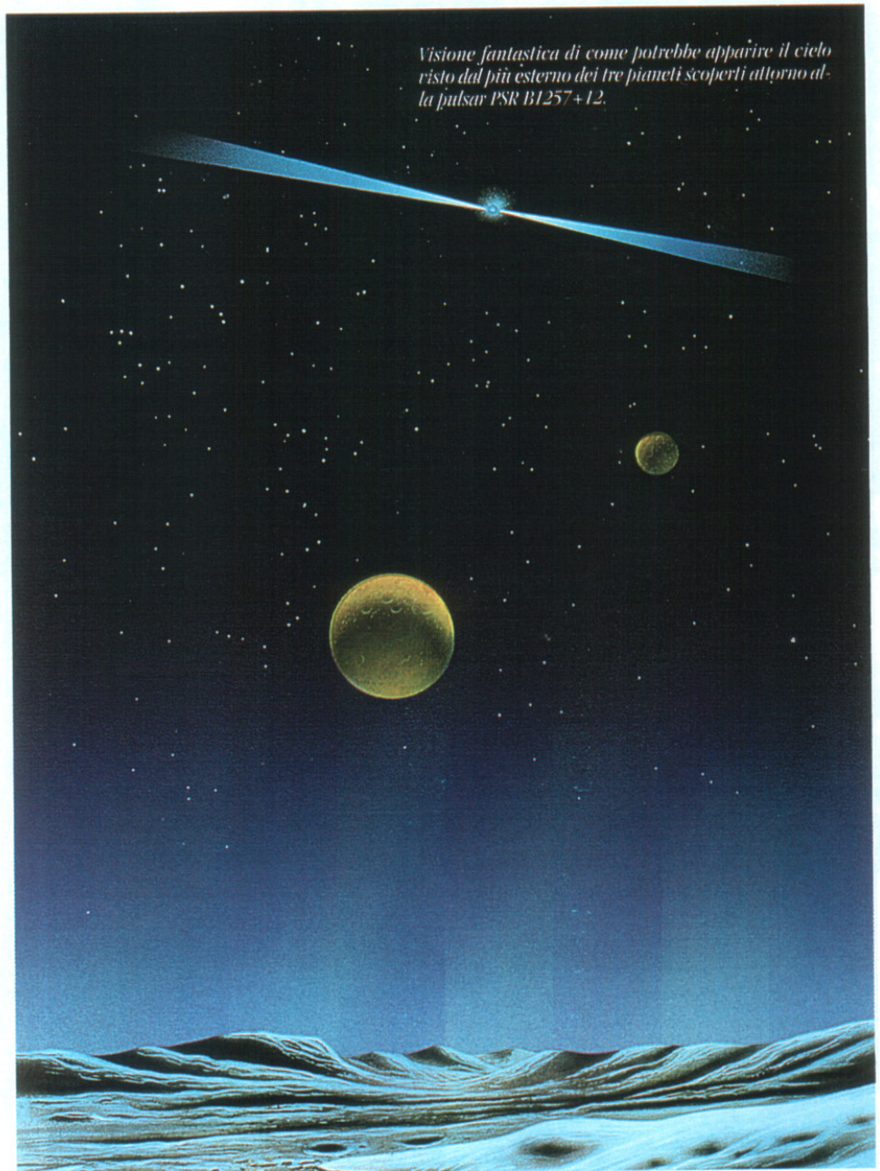
Visione fantastica di come potrebbe apparire il cielo visto dal più esterno dei tre pianeti scoperti attorno alla pulsar PSR B1257+12.

di fuori del Sistema Solare. Trovare altri sistemi planetari è risultato più difficile di quanto un inizio così incoraggiante facesse prevedere. Sono