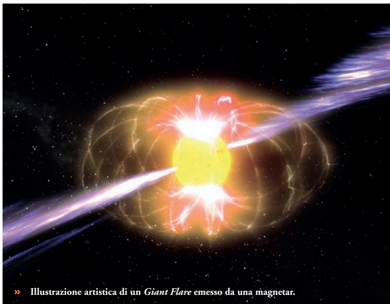
» Illustrazione artistica di un Giant Flare emesso da una magnetar.

alcune magnetar, stelle di neutroni con altissimi campi magnetici che possono produrre radiazione X e gamma di bassa energia in seguito a riarrangiamenti del loro spaventoso campo magnetico (nell'ordine dei dieci miliardi di tesla), che producono veri e propri terremoti stellari, gli "stellamoti".